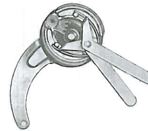
Bild 4. Fjäder för bromsback lossas